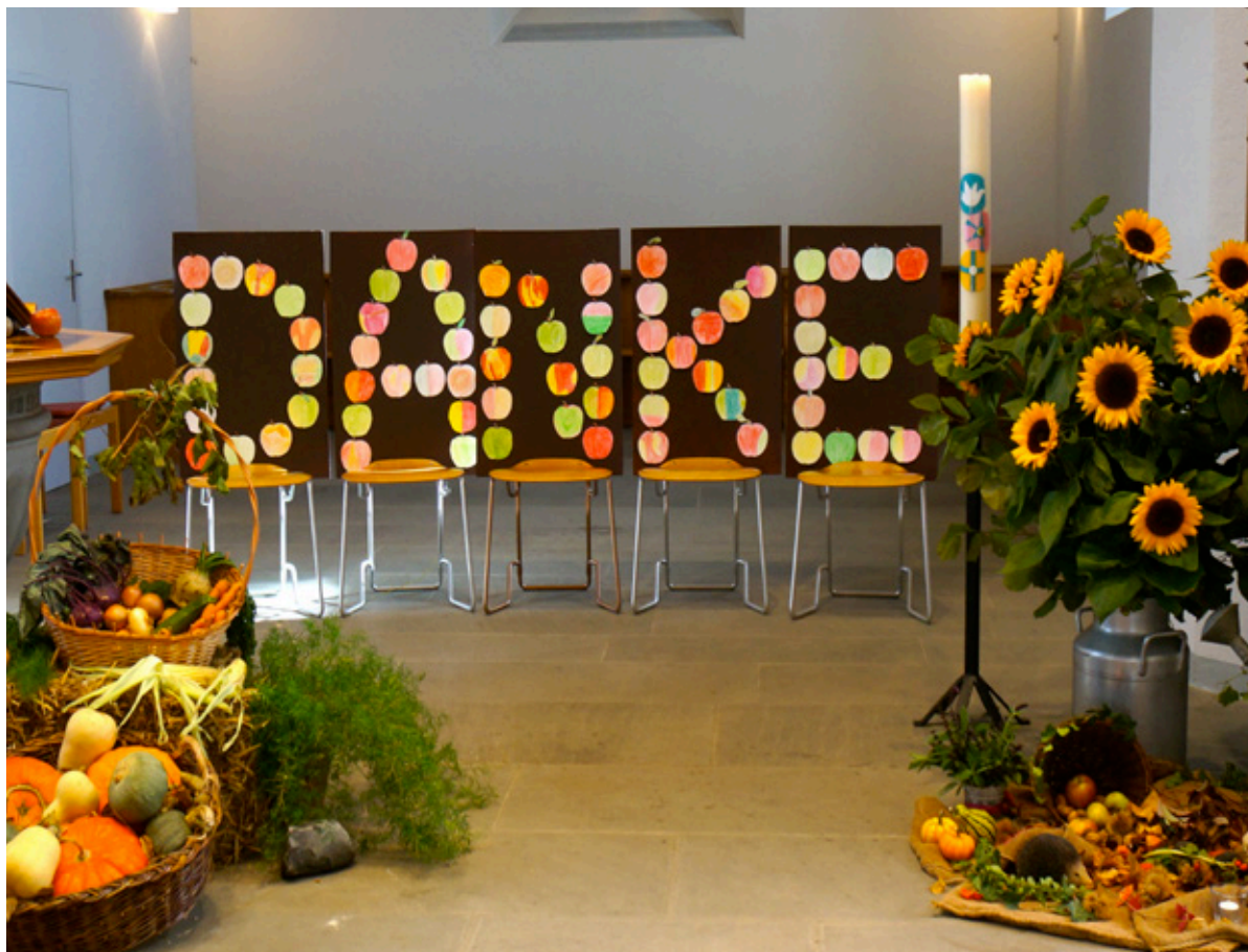
Dekoration und Buchstaben aus dem Erntedankgottesdienst 2017