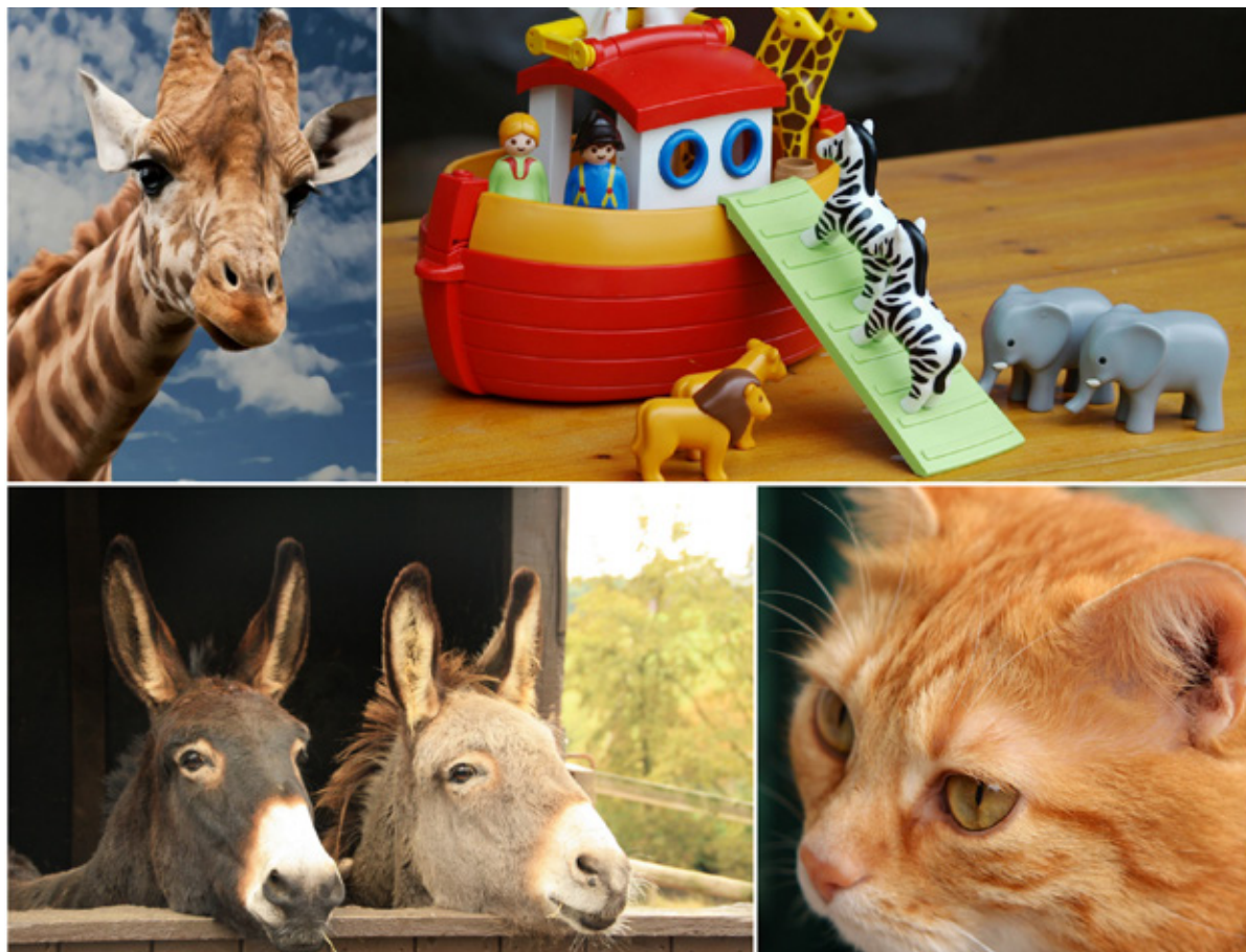
Die diesjährigen Kindertage sind aufs Tier gekommen. Kennst du alle Tiere? Ist dein Lieblingstier dabei?

Sonntag, 25. Februar 10.00 Uhr, Kirche Fehraltorf