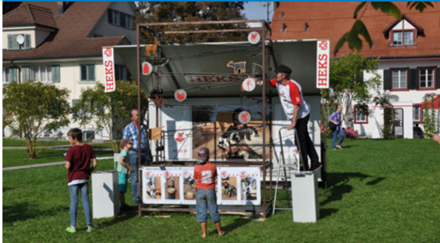
Geissenmaschine vom Hilfswerk der Evangelischen Kirchen Schweiz (HEKS) 2014